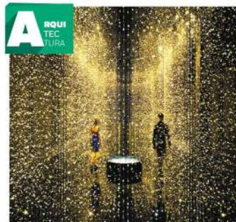
DGT ARCHITECTS La luz es tiempo >2