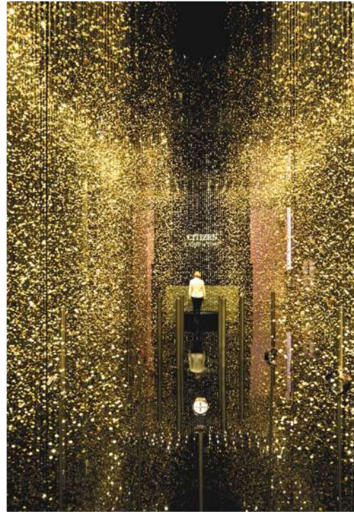
Imágenes cortesía de © DGT ARCHITECTS