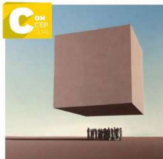
MEHDI GHADYANLOO Murales surrealistas >4