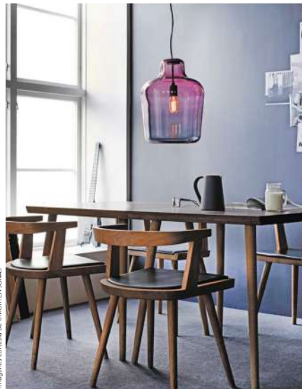
Imágenes cortesía de © MORTEN & JONAS

Hay proyectos que establecen un diálogo entre los materiales de los que están hechos y el proceso mismo del diseño. La conexión es tan íntima que no es posible distanciarlos. La lámpara Say my name es uno de ellos, pues emplea vidrio veneciano y técnicas de soplado italiano para su realización. Así, materia y forma quedan entrelazadas para resultar en una iluminación con mucha personalidad y que, por cierto, no pierde de vista la funcionalidad, ya que puede ser colgada del techo o colocada verticalmente sobre una mesa. Morten & Jonas, mentes detrás de Say my name , estudiaron durante cinco años en Bergen Academy of Art and Design, donde finalizaron su Maestría en Diseño y se especializaron en mobiliario y diseño espacial en mayo de 2011.