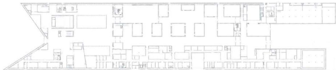
Plan du rez-de-chaussée.

TARTU (ESTONIE) Parmi les pays baltes, l'Estonie est le plus septentrional. Son histoire est intimement liée à celle des pays de la mer Baltique, qui ont durablement exercé leur influence sur ce pays, notamment la Finlande dont elle appartient à la même communauté linguistique et l'Allemagne. Après son annexion au début du 18 e siècle par la Russie, le sentiment national se réveille en Estonie, jusqu'à obtenir son indépendance en 1917, confirmée en février 1918. Mais elle subit la mainmise de l'Union soviétique dès septembre 1939, suite au pacte germano-soviétique, est occupée en juin 1940 et incorporée à l'URSS deux mois plus tard, tout en subissant de nombreuses déportations, puis est saisie par les Allemands à partir de juillet 1941 avant de retomber sous le joug soviétique en 1944. L'Estonie obtient finalement son indépendance en 1991. Elle adhère à l'Union européenne en 2004 et entre dans la zone Euro en 2011.