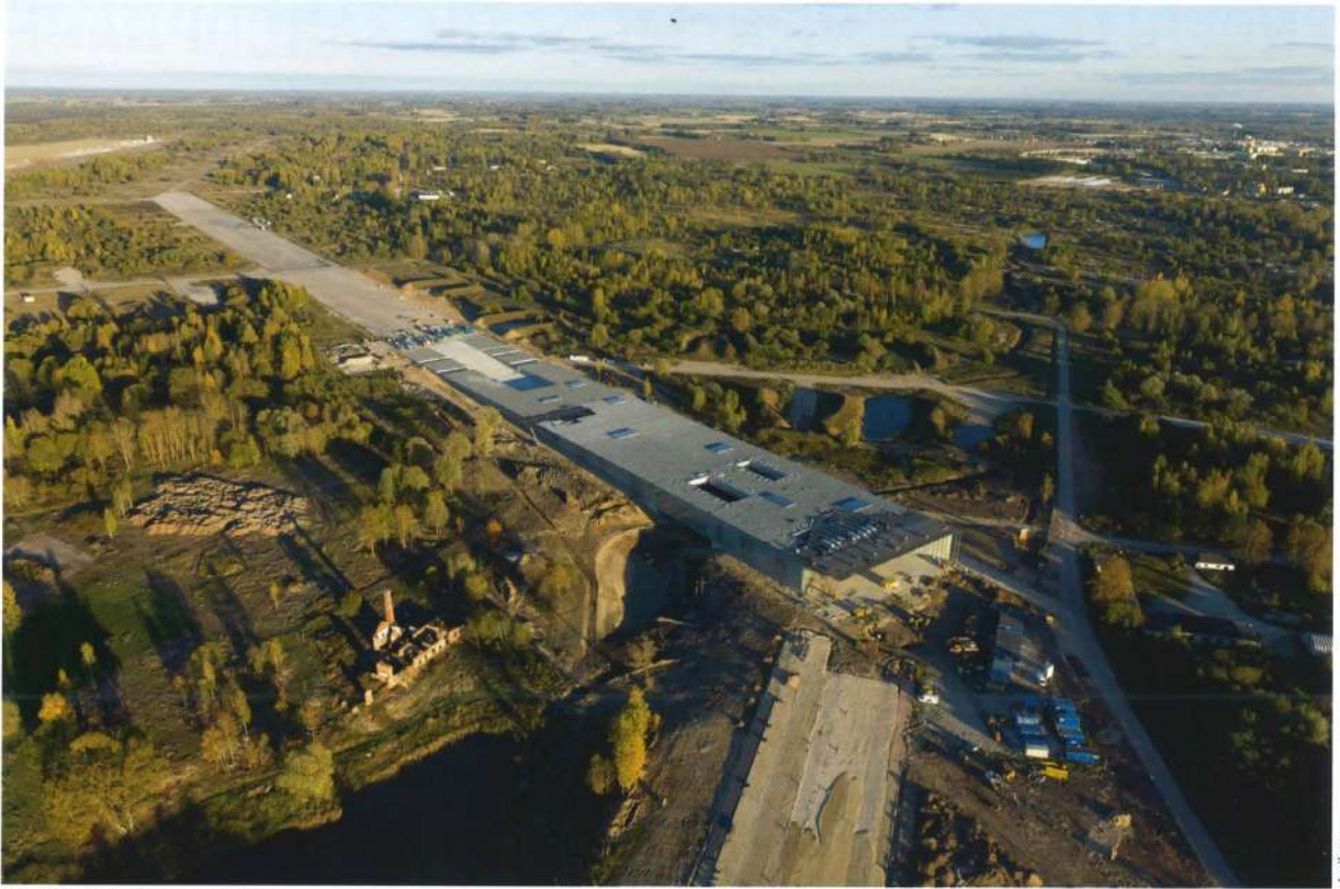
Vue aérienne du site en construction.