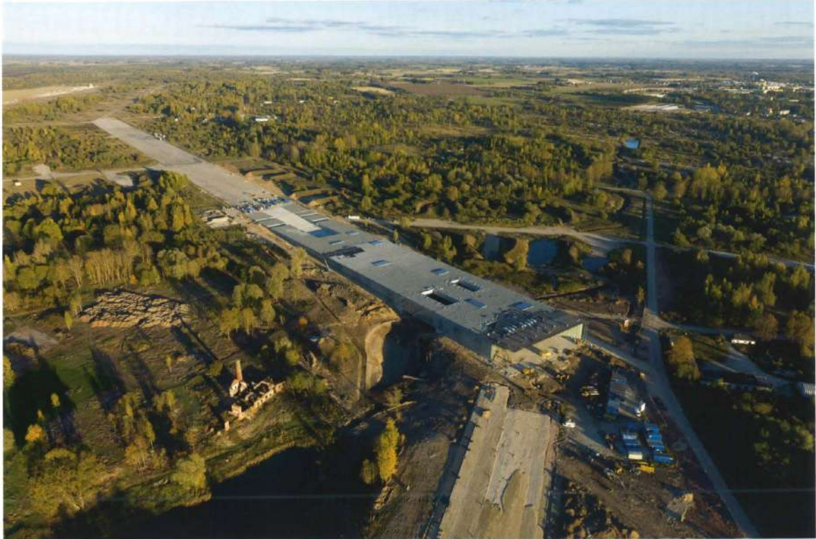
Vue aérienne du site en construction.