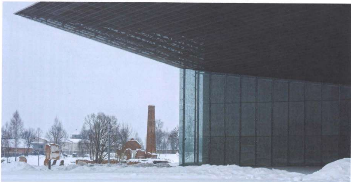
↑ La toiture du musée décolle pour accueillir les visiteurs