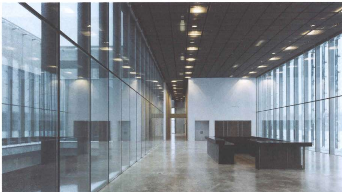
↑ Vue intérieure à l'entrée du musée